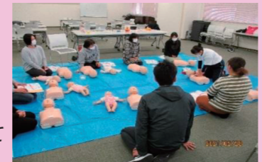
「幼児期に起こりやすい事故とその予防及び手当」について