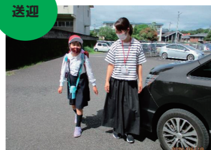
決められた場所まで迎えに行き...