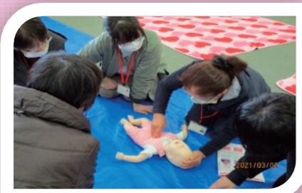
緊急救命の実技をおこないました