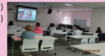
「子育て支援の仕組み」について