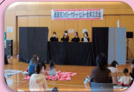
講師 学校図書司書 「お話グループぶっくる」の皆様