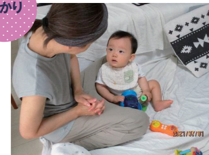
サポート会員さん宅でお預かり