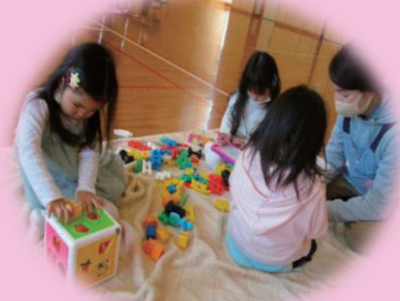
保育士による会員の子どもの見守り