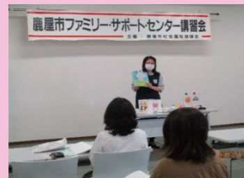
「子どもの発達と遊び方」について