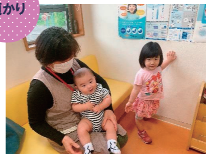
待合室でお預かり