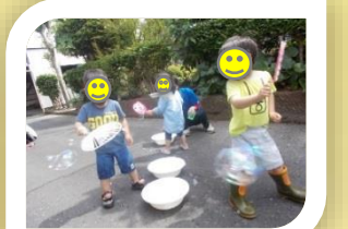
しゃぼんだまあそび