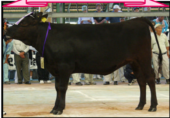
若雌1区にて首席のかずみ号