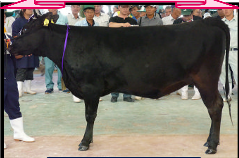
若雌2区にて首席のゆか号